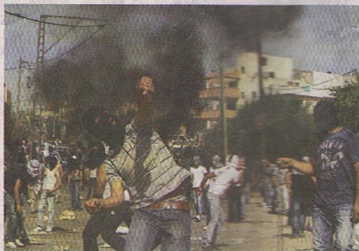
ההתפרעות ההמונית אתמול באום אל-פאחם